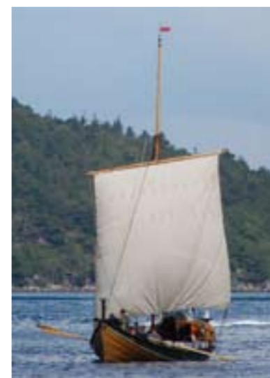
Dragens Vinge på vei inn Riskafjorden.