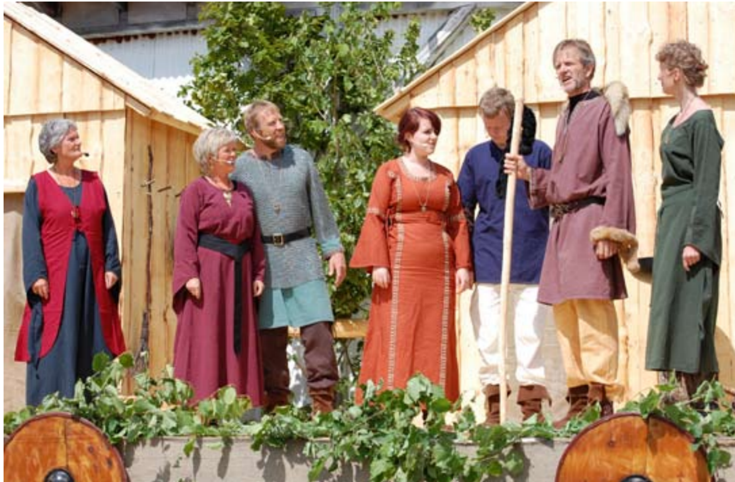
Bryllup på Horgstad.