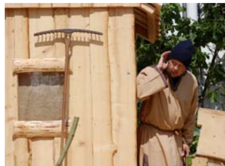
Trellen Wir tjuvlytter.