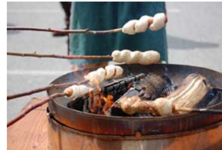
Pølse- og pinnebrødgrilling.

Arnø legger til at det er de samme skuespillerne som har vært med år etter år, kun én skuespiller har blitt «erstattet», men det er fordi han har flyttet for langt vekk fra Riska til å kunne være med. - Hvem er skuespillerne? - Alle skuespillerne er fra Riska, men unntak av én som er fra